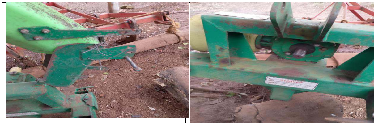
FOTO 41 a 44: COLHEDOURA DE FORRAGEM CREMASCO – PATRIMÔNIO: 24.409.

e-mail: agricultura@chopinzinho.pr.gov.br Telefax: (46) 3242-2503 - Rua 14 de Dezembro, 3977 – Centro CEP: 85.560-000 Chopinzinho - Paraná