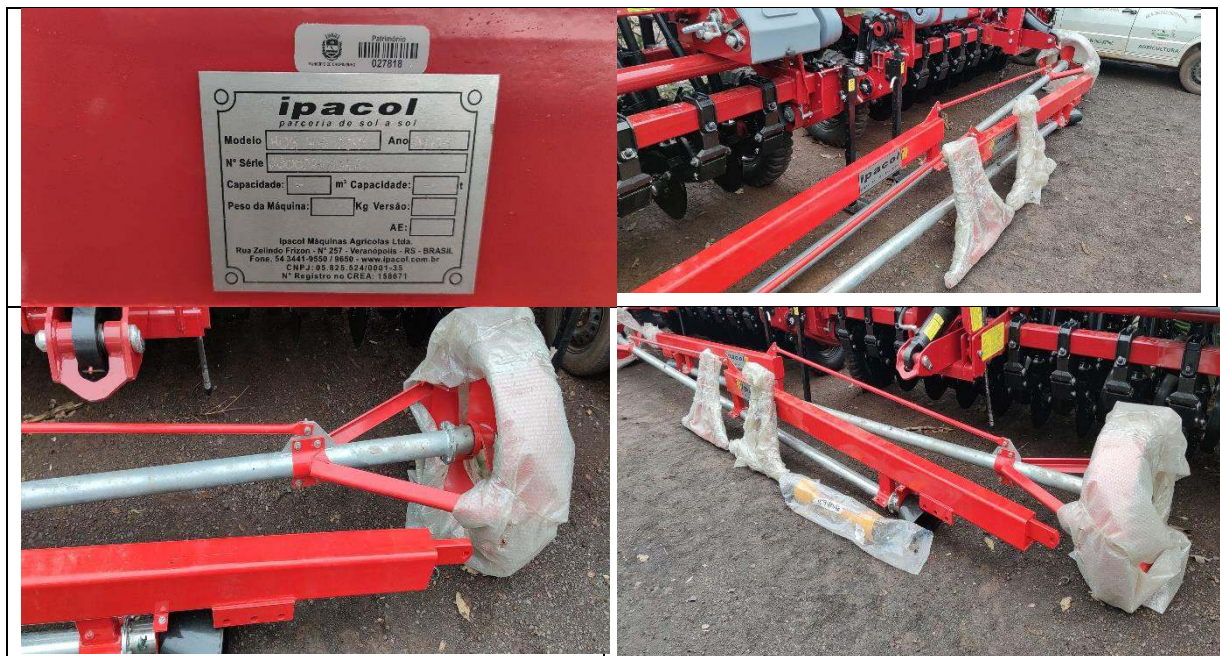
FOTO 25 a 28: HOMOGENIZADOR DE ESTERCO – IPACOL – PATRIMÔNIO: 27.818.

e-mail: agricultura@chopinzinho.pr.gov.br Telefax: (46) 3242-2503 - Rua 14 de Dezembro, 3977 – Centro CEP: 85.560-000 Chopinzinho - Paraná