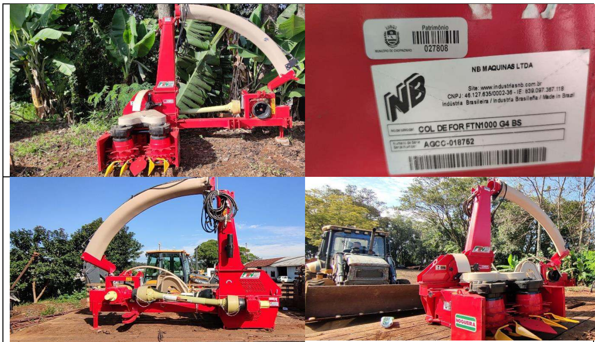
FOTO 09 a 12: COLHEDORA DE FORRAGEM ÁREA TOTAL-NOGUEIRA-FTN 1000 – PATRIMÔNIO: 27.808.

e-mail: agricultura@chopinzinho.pr.gov.br Telefax: (46) 3242-2503 - Rua 14 de Dezembro, 3977 – Centro CEP: 85.560-000 Chopinzinho - Paraná