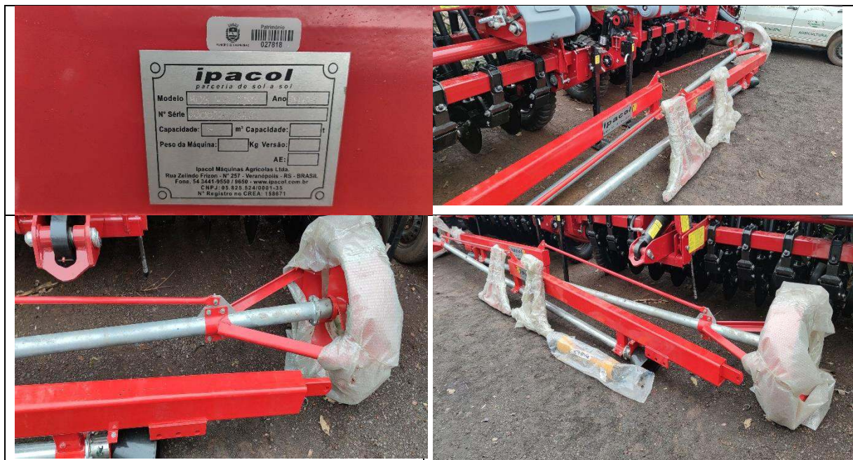
FOTO 25 a 28: HOMOGENIZADOR DE ESTERCO – IPACOL – PATRIMÔNIO: 23005240022.

e-mail: agricultura@chopinzinho.pr.gov.br Telefax: (46) 3242-2503 - Rua 14 de Dezembro, 3977 – Centro CEP: 85.560-000 Chopinzinho - Paraná