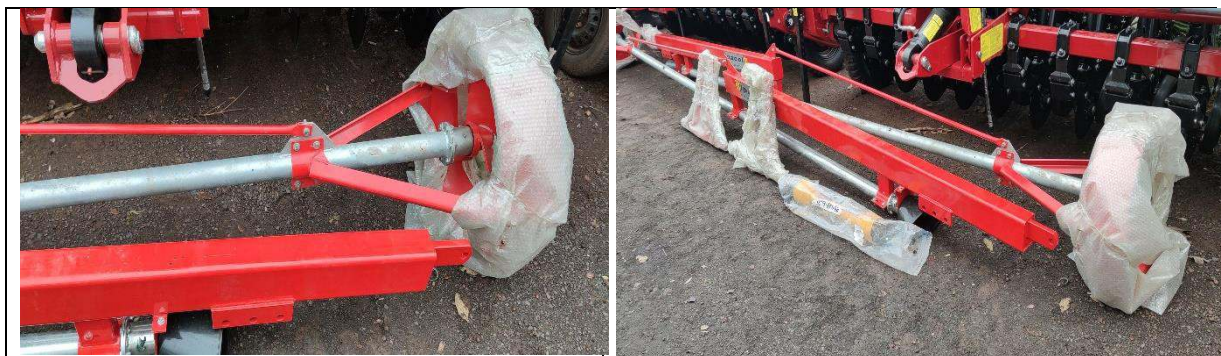
FOTO 25 a 28: HOMOGENIZADOR DE ESTERCO – IPACOL – PATRIMÔNIO: 23005240022.

e-mail: agricultura@chopinzinho.pr.gov.br Telefax: (46) 3242-2503 - Rua 14 de Dezembro, 3977 – Centro CEP: 85.560-000 Chopinzinho - Paraná