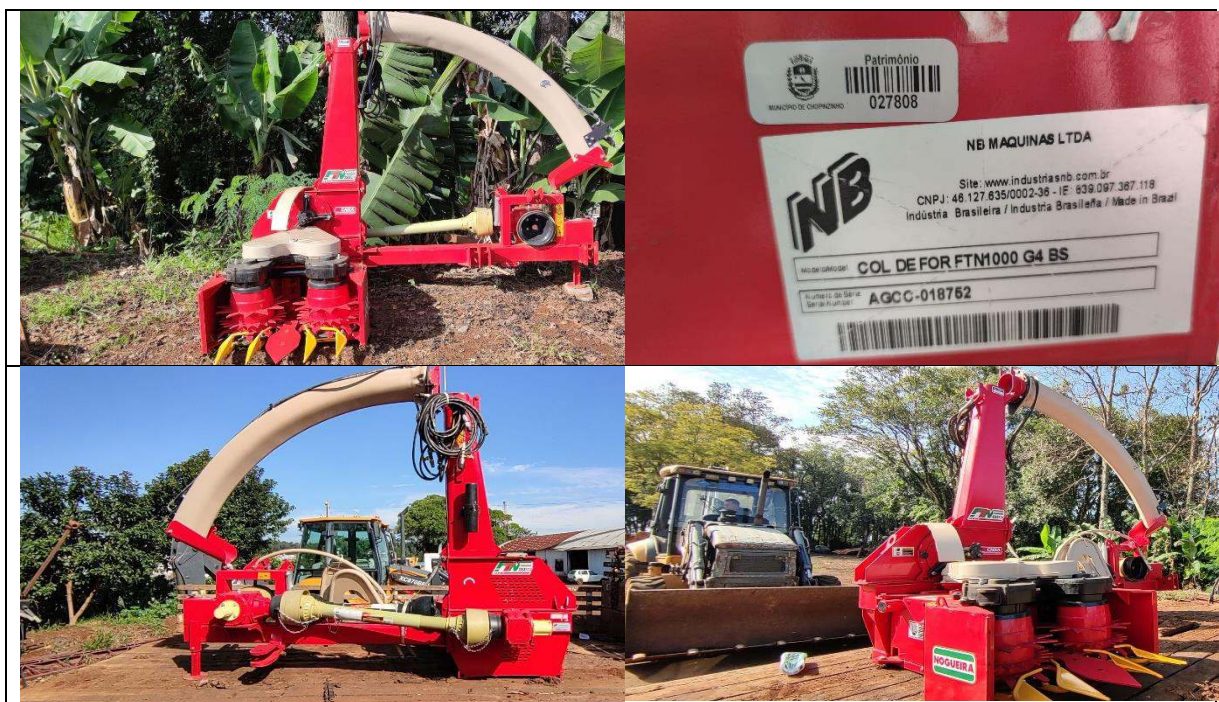
FOTO 09 a 12: COLHEDORA DE FORRAGEM ÁREA TOTAL-NOGUEIRA-FTN 1000 – PATRIMÔNIO: 27.808.