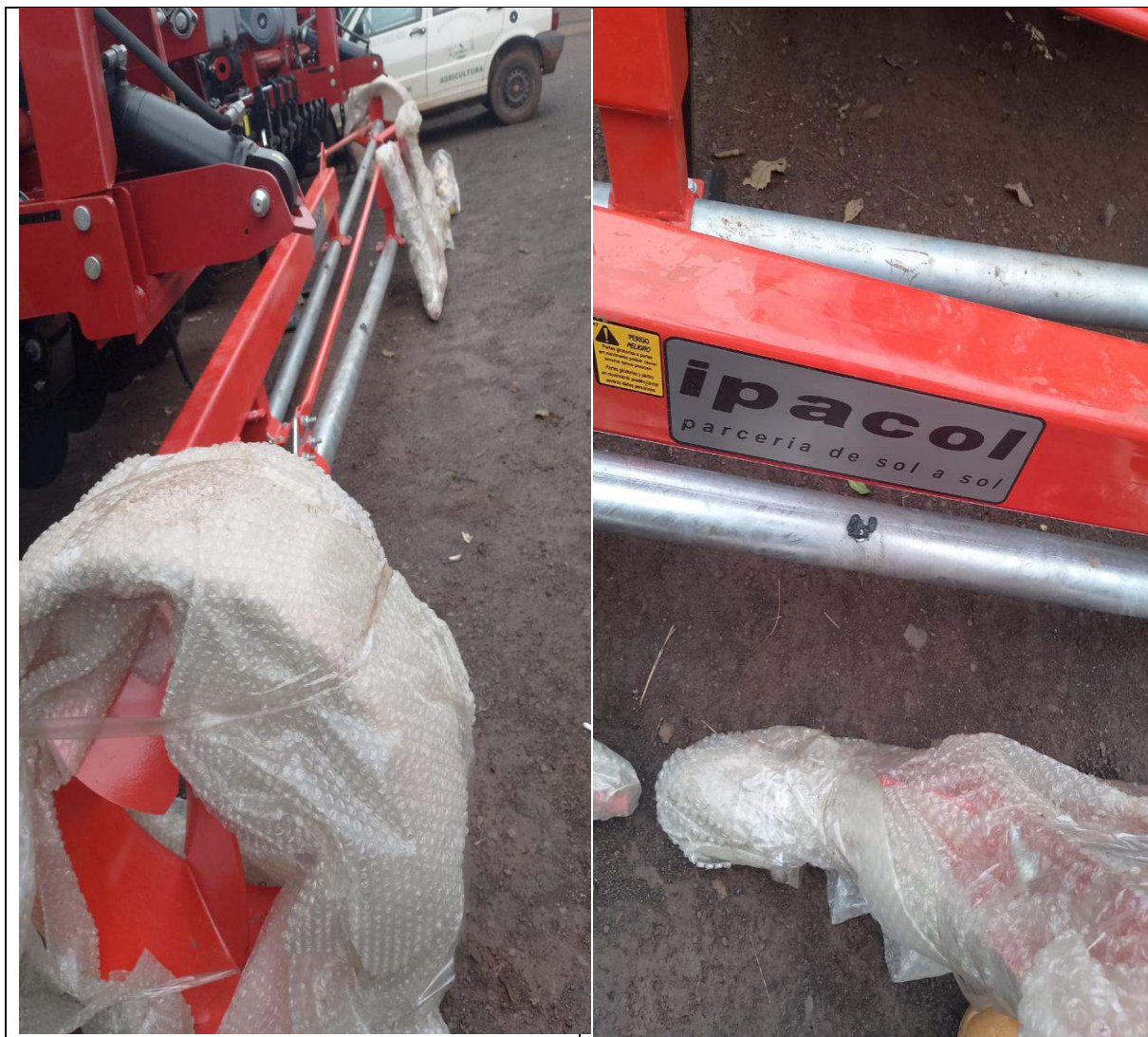
FOTO 29 a 32: HOMOGENIZADOR DE ESTERCO – IPACOL – PATRIMÔNIO: 27.819.

e-mail: agricultura@chopinzinho.pr.gov.br Telefax: (46) 3242-2503 - Rua 14 de Dezembro, 3977 – Centro CEP: 85.560-000 Chopinzinho - Paraná