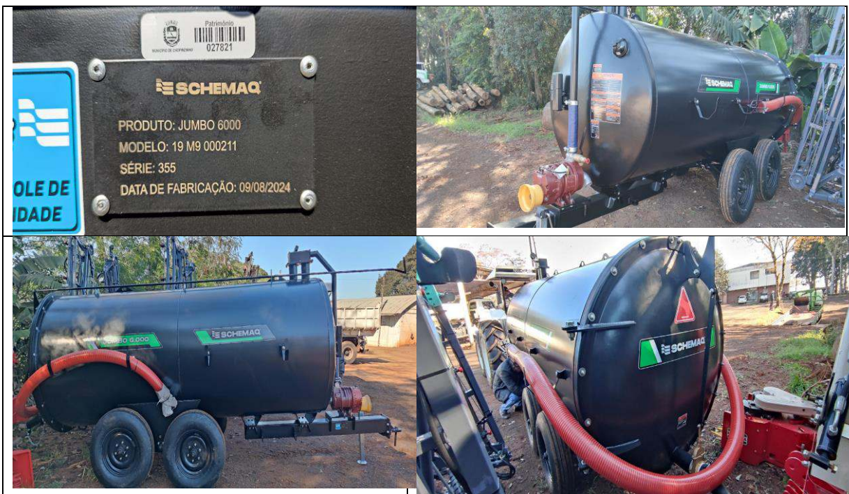
FOTO 37 a 40: DISTRIBUIDOR DE ESTERCO SCHEMAQ – PATRIMÔNIO: 27.821.