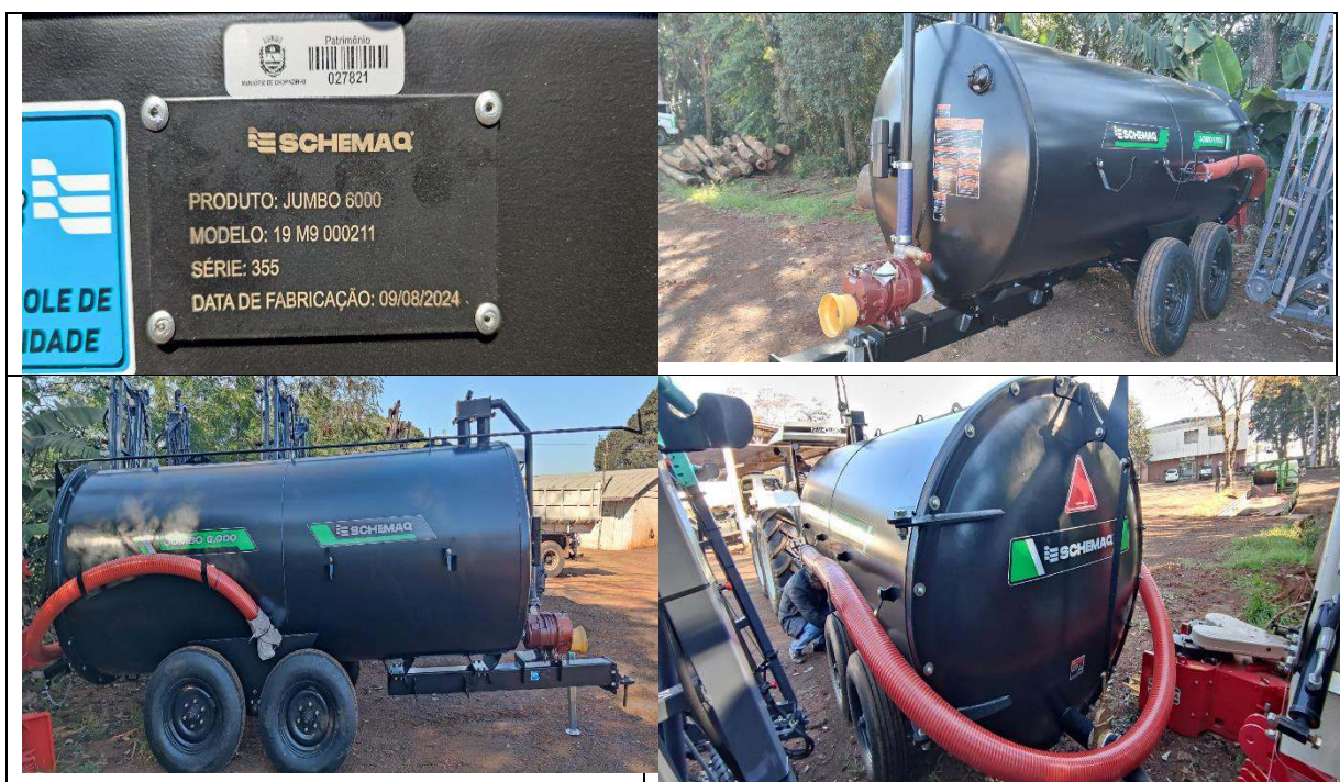
FOTO 37 a 40: DISTRIBUIDOR DE ESTERCO SCHEMAQ – PATRIMÔNIO: 27.821.