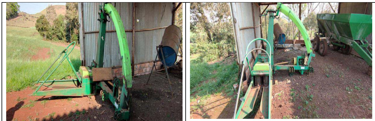
FOTO 41 a 44: COLHEDOURA DE FORRAGEM CREMASCO – PATRIMÔNIO: 24.408.

e-mail: agricultura@chopinzinho.pr.gov.br Telefax: (46) 3242-2503 - Rua 14 de Dezembro, 3977 – Centro CEP: 85.560-000 Chopinzinho - Paraná