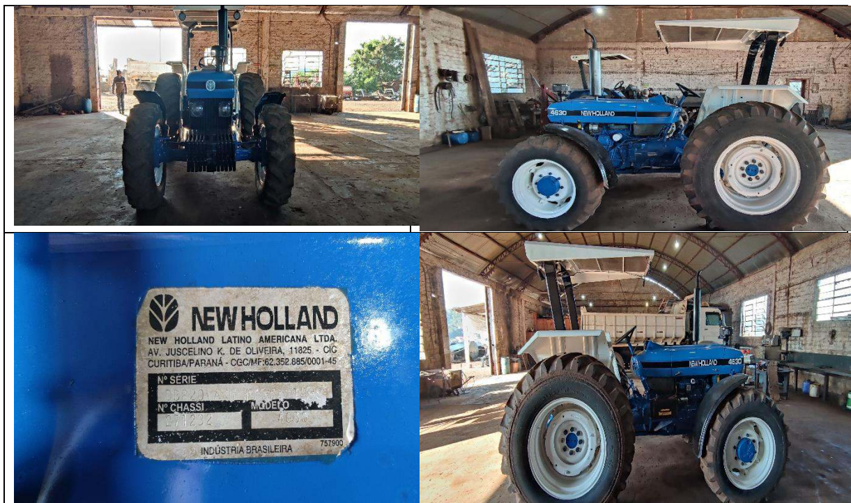
FOTO 05 a 08: TRATOR AGRÍCOLA NEW HOLLAND-4630 – PATRIMÔNIO: 7.665.