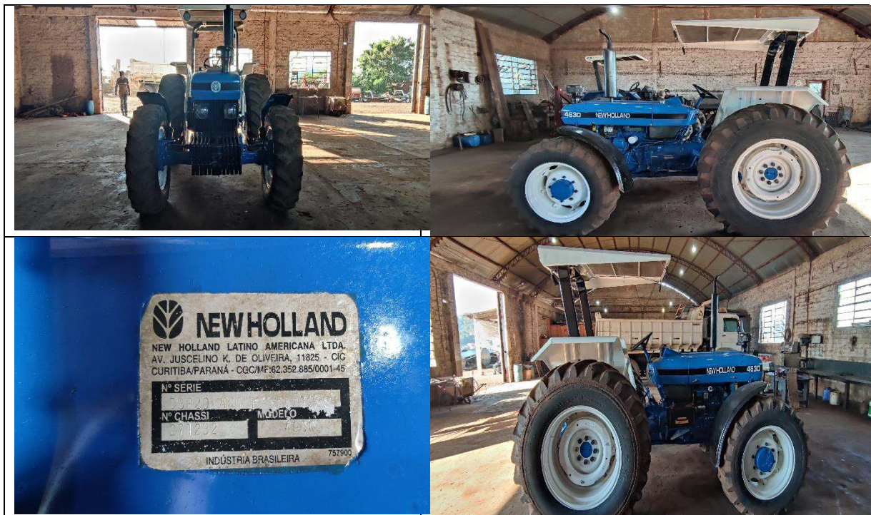
FOTO 05 a 08: TRATOR AGRÍCOLA NEW HOLLAND-4630 – PATRIMÔNIO: 7.665.

e-mail: agricultura@chopinzinho.pr.gov.br Telefax: (46) 3242-2503 - Rua 14 de Dezembro, 3977 – Centro CEP: 85.560-000 Chopinzinho - Paraná