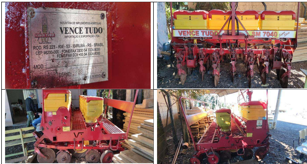
FOTO 01 a 04: PLANTADEIRA PLANTIO DIRETO-VENCE TUDO SM 7040- PATRIMÔNIO: 22.255

e-mail: agricultura@chopinzinho.pr.gov.br Telefax: (46) 3242-2503 - Rua 14 de Dezembro, 3977 – Centro CEP: 85.560-000 Chopinzinho - Paraná