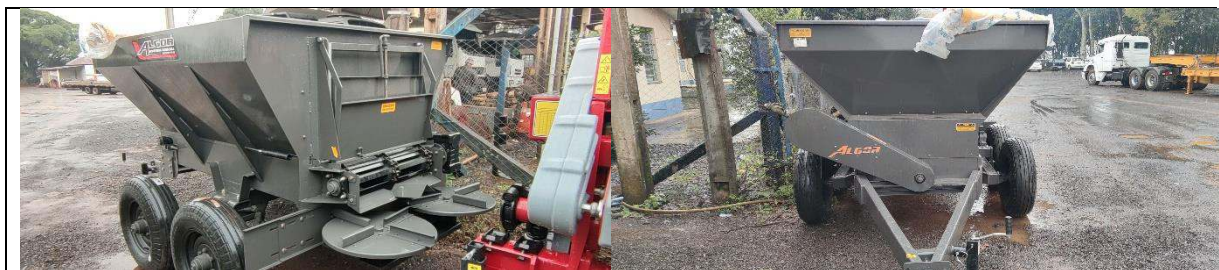
FOTO 33 a 36: DISTRIBUIDOR DE CALCÁRIO E FERTILIZANTES-ALGOR – PATRIMÔNIO: 27.820.

e-mail: agricultura@chopinzinho.pr.gov.br Telefax: (46) 3242-2503 - Rua 14 de Dezembro, 3977 – Centro CEP: 85.560-000 Chopinzinho - Paraná